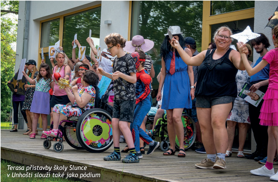
Terasa přístavby školy Slunce v Unhošti slouží také jako pódium