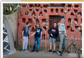
Dopravu na pobyt v přírodě jsme zrealizovali díky podpoře společnosti Philip Morris ČR

Začátkem května někteří z nás vyrazili na jarní pobyt do hotelu AURI v Rudníku. Všichni jsme si pobyt moc užili. Počasí nám přálo, hotel byl útulný, personál příjemný a vstřícný, jídlo velmi chutné. Stihli jsme toho opravdu hodně - výlet do ZOO ve Dvoře Králové, naučnou stezku, návštěvu kostela s výkladem jeho historie a poslechem hry na varhany, procházky krásnou přírodou a na závěr noční bojovku.