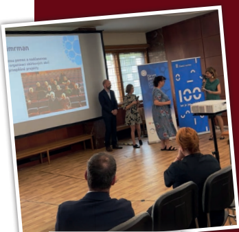
Dvě ceny Fóra dárců pro podporovatele Slunce